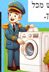
אבא יותר מסודר מהחדר שלך

בחוף אבא טייס מומחה, הוא קפסן הטיסה בבית אבא שואל את אמא איך מפעילים מכונת כביסה