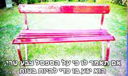
אם תאמר לו פי על הספסל צבע טרי, הוא יגע בו כדי להיות בטוח