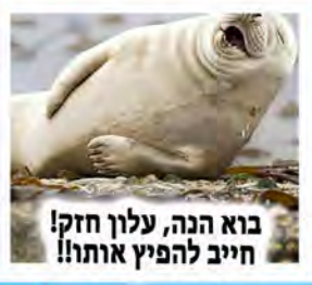
בוא הנה, עלון חזק! חייב להפיץ אותו!

כל המחירים ללא מע"מ אם אתה רוצה אלה אחר תבוא אחר