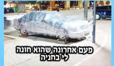
פעם אחרונה שהוא חוננה לי בתניה

בחוף אבא טייס מומחה, הוא קפסן הטיסה בבית אבא שואל את אמא איך מפעילים מכונת כביסה