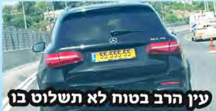
עין הרב בטוח לא תשלוט בו